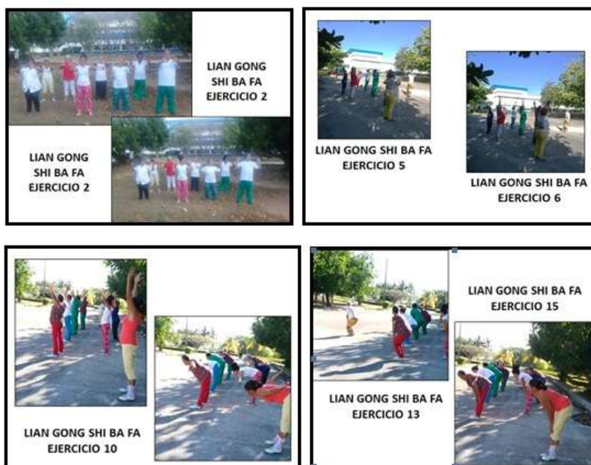
Figura 2. Demostración de algunos de los ejercicios del Lian Gong Shi Ba Fa por los participantes